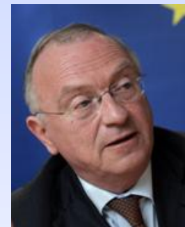
Luc Van den Brande